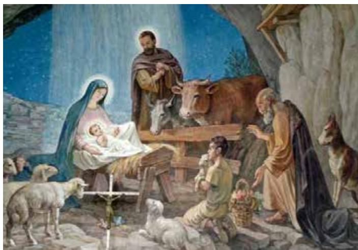
Muurschildering in de kapel gebouwd bij het herdersveld te Bethlehem

Wat is die vrede van Christus? Wat heeft die ons in onze tijd nog te zeggen? Wat stelt dat nog voor, in onze tijd waarin zovelen zoveel lijden ondergaan? Waarom grijpt hij eigenlijk niet zelf gewoon in? Hij geeft ons zijn vrede, maar "niet zoals de wereld die geeft", geeft hij die ons. Zijn vrede is veel meer dan afwezigheid van oorlog, afwezigheid van geweld. Hij wil nadrukkelijk niet dat wij tevreden om ons heen kijken, vaststellen dat we het zo slecht nog niet hebben – want laten we eerlijk zijn, zo slecht hebben wij het in Nederland niet – en dan rustig achterover leunen en het leven aan ons laten gebeuren. Nee, zelfgenoegzaam mogen we nooit zijn. Zijn vrede is veel meer dan uiterlijke rust. Hij wil ons die innerlijke vrede geven. Zelf heeft hij ons het voorbeeld gegeven