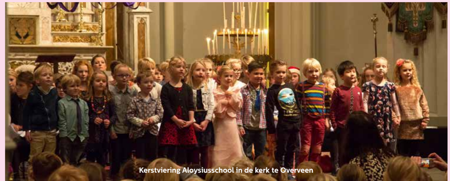
Kerstviering Aloysiusschool in de kerk te Overveen

Een grijze spin liep over de vloer van de herberg. 'Oh', gilte de dochter van de herbergier. 'Maak dat je wekomt, lelijk mormel.' – 'Zou ik werkelijk lelijk zijn?', vroeg de spin zich af, toen hij tegen de muur opklom. 'Hoe het ook zij, mijn web is prachtig.' Hij spon een mooi groot web en zocht er een goed plaatsje in om de nacht door te brengen. Maar de volgende morgen, o hemeltje lief, de herbergierster kwam er aan met haar bezem. 'Wat! Een spinnenweb in mijn schone kamer!', riep ze. Ze veegde het prachtige web naar beneden en verjoeg de spin. 'Daar ga je', zei ze en joeg hem met haar bezem weg. 'Ik kan spinnen met hun lelijke harige lichaam en afschuwelijke lange poten niet uitstaan.' 'Niemand mag me', jammerde de spin, toen hij weging naar de herbergstal en hij begon een web te spinnen van de ene balk naar de andere. Daar viel niemand hem lastig. De dieren onder hem waren hem eigenlijk dankbaar, omdat hij de vliegen ving, die hen bij warm weer plaagden.